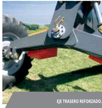
EJE TRASERO REFORZADO.