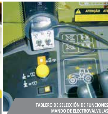
TABLERO DE SELECCIÓN DE FUNCIONES. MANDO DE ELECTROVÁLVULAS.