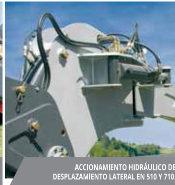
ACCIONAMIENTO HIDRÁULICO DE DESPLAZAMIENTO LATERAL EN 510 Y 710.