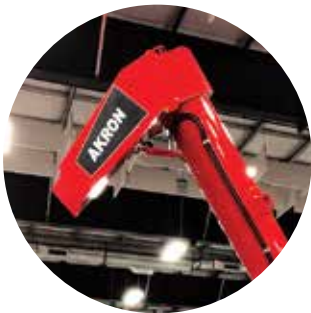
PICO PIVOTANTE HIDRÁULICO