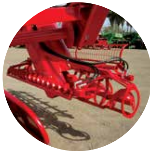
KIT PARA ARROZ