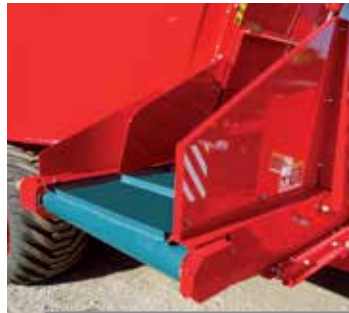
NORIA DE PVC CON DESPLAZAMIENTO TRANSVERSAL.