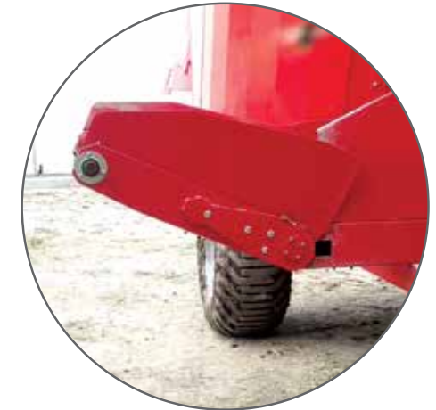
NORIA REBATIBLE A CADENA