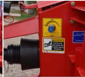
REGULACIÓN DE VELOCIDAD DE LA NORIA.