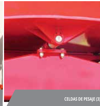
CELDA DE PESAJE (3).