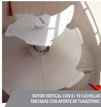
ROTOR VERTICAL CON 8 / 10 CUCHILLAS TRATADAS CON APORTE DE TUNGSTENO.