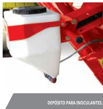
DEPÓSITO PARA INOCULANTES.