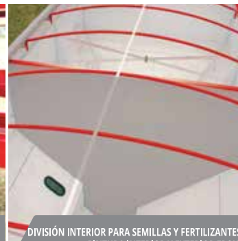
DIVISIÓN INTERIOR PARA SEMILLAS Y FERTILIZANTES. PINTURA INTERIOR Y EXTERIOR EPOXI.