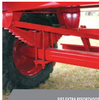
EJES EXTRA REFORZADOS.

Mando hidráulico comandado con electroválvulas desde el punto operativo (botón ON/OFF).