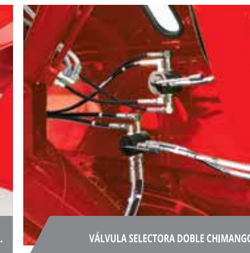
VÁLVULA SELECTORA DOBLE CHIMANGO