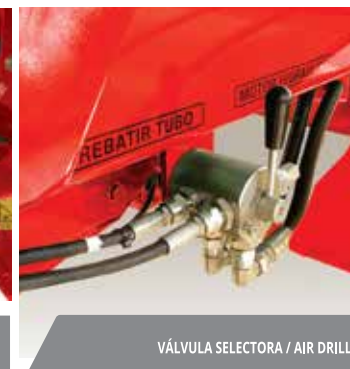
VÁLVULA SELECTORA / AIR DRILL.