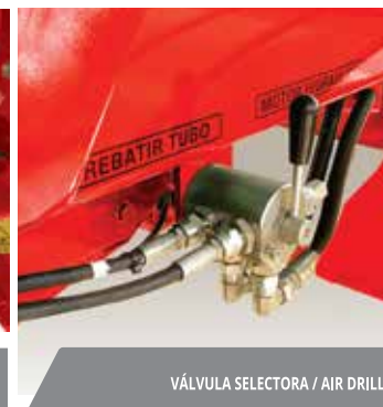
VÁLVULA SELECTORA / AIR DRILL.