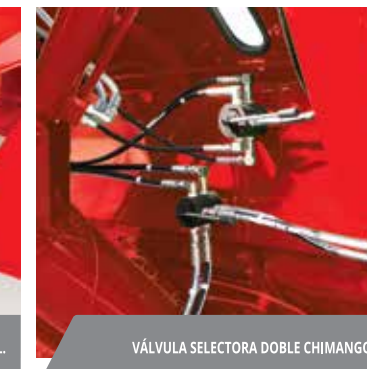
VÁLVULA SELECTORA DOBLE CHIMANGO