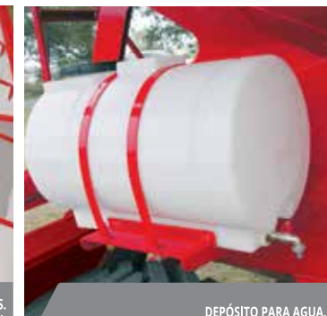
DEPÓSITO PARA AGUA.