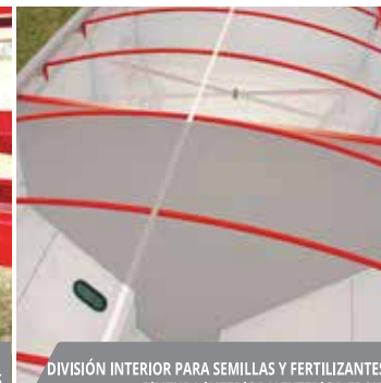
DIVISIÓN INTERIOR PARA SEMILLAS Y FERTILIZANTES. PINTURA INTERIOR Y EXTERIOR EPOXI.